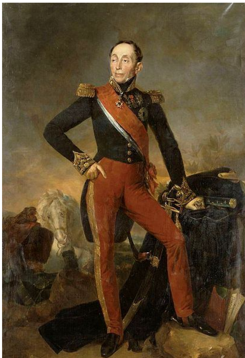
Эммануэль Груши. Картина работы Жана Себастьяна Руйара.

Так страшно мстит за себя великое, неповторимое мгновение, лишь изредка выпадающее на долю смертного, если тот, кто призван по ошибке, отступает от него. Все мещанские добродетели — надежный щит от требований мирно текущих будней: осмотрительность, рвение, здравомыслие, — все они беспомощно тают в пламени одной-единственной решающей секунды, которая открывается только гению и в нем ищет свое воплощение. С презрением отталкивает она малодушного; лишь отважного возносит она огненной десницей до небес и причисляет к сонму героев.