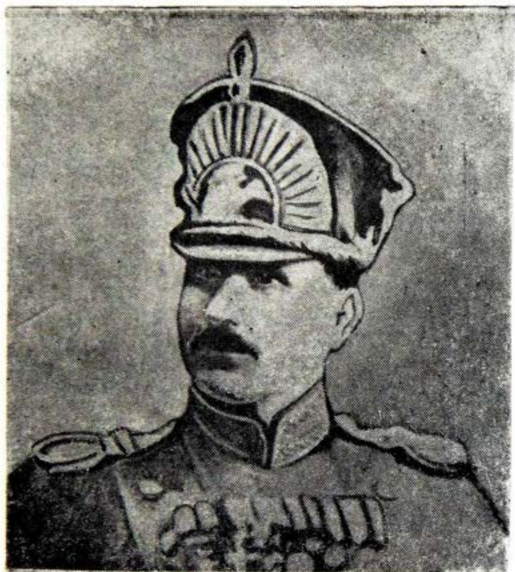
М. А. МУРАВЬЕВ В ФОРМЕ ОФИЦЕРА ЦАРСКОЙ АРМИИ