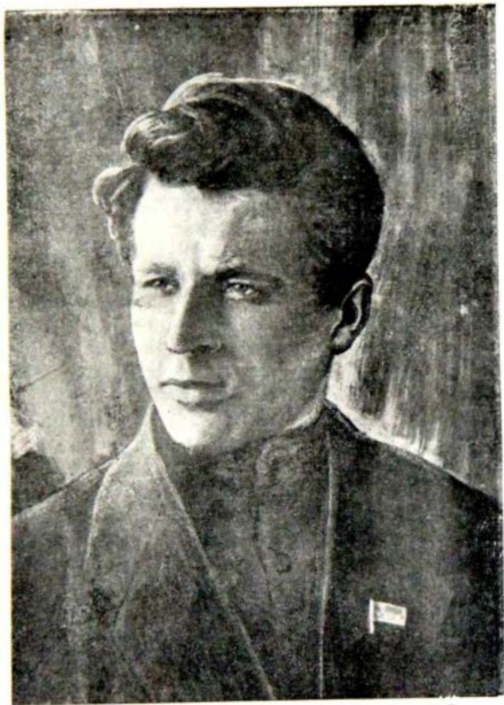
И. М. ВАРЕЙНИС (СНИМОК 1918 Г.)