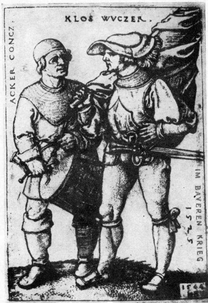
Ганс Бегам. Барабанщик и знаменосец восставших крестьян.