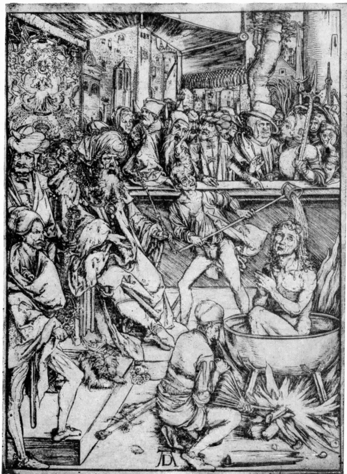
А. Дюрер. Из серии гравюр на темы Апокалипсиса.