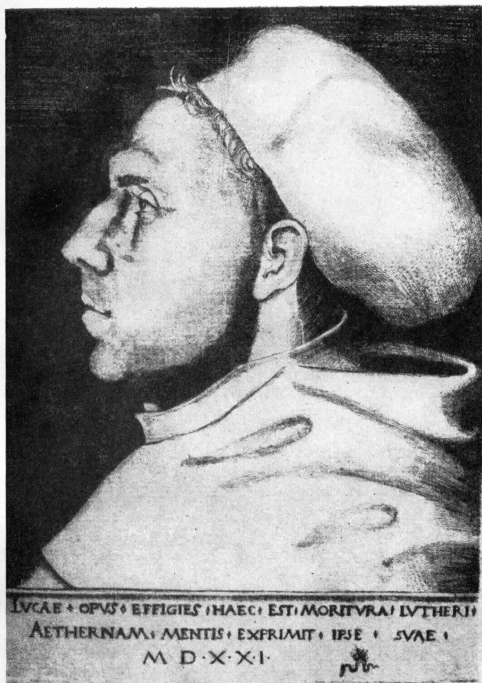
Л. Кранах. Мартин Лютер, 1521.