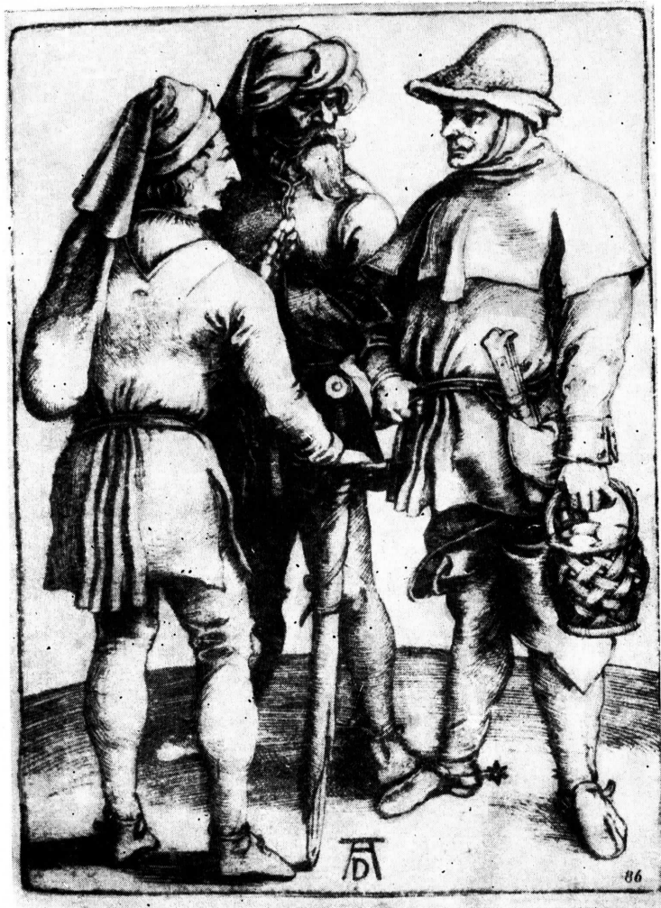
А. Дюрер. Крестьяне.