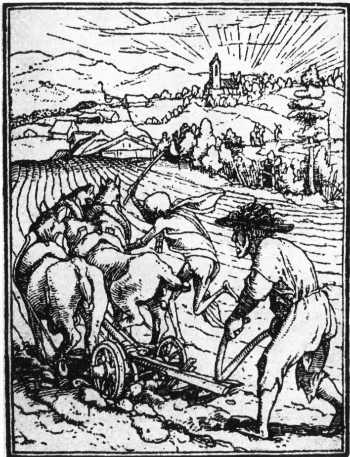
Г. Гольбейн Младший. Из цикла гравюр «Пляска смерти».