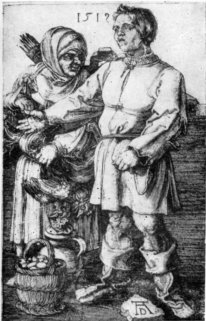
А. Дюрер. Крестьяне на рынке.