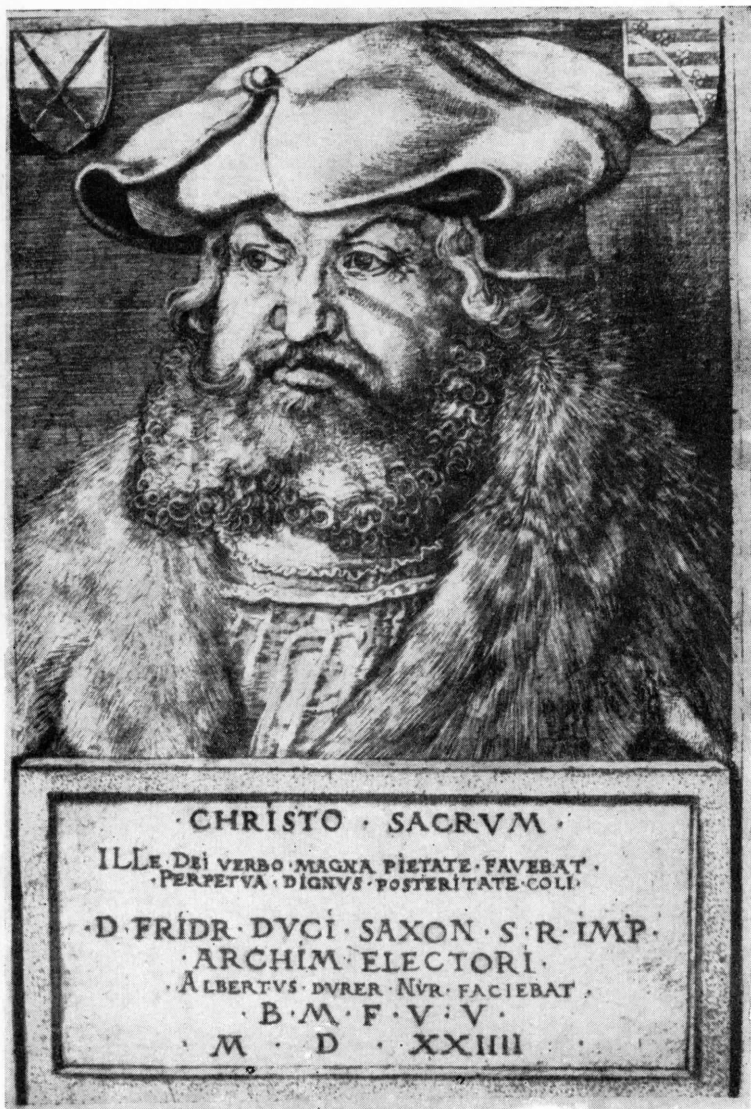
А. Дюрер. Фридрих Саксонский.