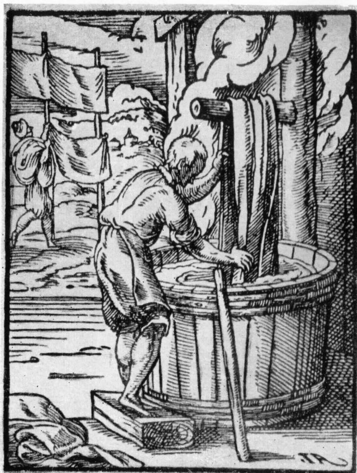
Ност Амман. Красильщик.