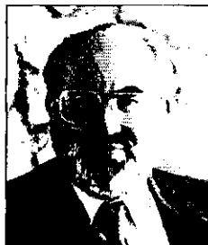
Дэниел ЭЛЕЙЗЕР (1934, Митсеполице – 1999, Иерусалим) – выдающийся исследователь федерализма, автор ряда известных работ по политической культуре.

Широкую известность в науке получила классификация политической культуры, предложенная Алмондом и Вербой в одном из важнейших трудов мировой политологии «Гражданская культура» (1963). Анализируя и сопоставляя основные компоненты и формы функционирования политических систем Англии, Италии, ФРГ, США и Мексики, они выделили три «чистых» типа политической культуры: приходская , или парокиальная (англ. parochial, от гр. paroia – около, возле, oikos — место обитания, домохозяйство; иначе — местечковая, патриархальная ), для которой характерно отсутствие интереса людей к политике, знаний о политической системе и существенных ожиданий от ее функционирования; подданическая (англ. subject), где сильна ориентация на политические институты, но невысок уровень индивидуальной активности граждан; партиципаторная , или участническая (англ. participant), отражающая заинтересованность граждан в политическом участии и проявление ими соответствующей активности.