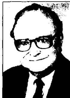
Сеймур Мартин ЛИПСЕТ (род. 1922, Нью-Йорк) – американский политолог, сделавший социологический анализ неотъемлемой частью современной политологии; внес значительный вклад в понимание условий демократизации.

де всего в доходах). В популистской модели, напротив, главенствует равенство, ради которого увеличиваются возможности политического участия, принимаются меры по обеспечению равного положения людей в материальном плане и, при необходимости, по удержанию темпов экономического роста на относительно низком уровне. Если технократическая схема модернизации, как правило, ведет к использованию принуждения (даже репрессий) для предотвращения широкого участия людей в политике, то популистская способна стать причиной гражданских столкновений из-за резкого расширения подобного участия. Такими доводами ученый показывает несовместимость основных целей модернизации: не равенство влияет на степень политического участия, а именно последнее воздействует на равенство. В этом состоит отличие теории Хантингтона от либеральной модели развития Д. Лернера и С.М. Липсета , которая предполагает, что увеличение равенства позволяет достичь более высокого уровня политического участия.