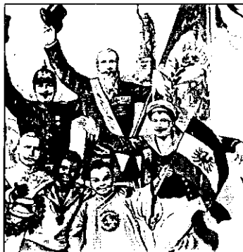
Плакат рубежа XIX–XX вв., прославляющий цивилизаторскую миссию Германии.

Таким образом, модернизация, представлявшая еще в прошлом веке специфически организованный переходный период, в начале XXI столетия превращается в типологическое состояние, в довольно длительное межстадиальное движение со своими закономерностями, культурными и идейными предпочтениями, вариантами политико-институциональных изменений. Все это уже нельзя вписать в устаревшую схему «современный экономический рост > становление системы политического представительства». Тем более что политологи доказали: сам экономический рост (за исключением «новых индустриальных обществ» Дальнего Востока) так и не смог подчинить своим законам социальное