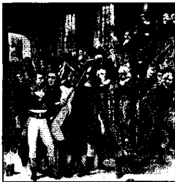
Конфликт Наполеона с депутатами Совета пятисот 18 брюмера (1799), завершившийся государственным переворотом, ликвидировавшим режим Директории.

Государственный переворот — внезапный неконституционный захват власти, незаконная смена правящей элиты в целом (президентства, правительства, персонала управленческих структур), которые не связаны с какими-либо коренными изменениями политического режима, социальных и экономических отношений. Общее для революции и государственного переворота — коллективный и насильственный характер политического действия, а также стремление с помощью пропаганды идеологизировать событие. Различает эти понятия то обстоятельство, что источником государственного переворота обычно бывает заговор, причем организованный внутри самих государственных институтов. У государственного переворота нет иных целей, кроме разрушения легитимности существующей власти, утверждения во главе государства другой личности или меньшинства, которое будет удерживать обретенные полномочия силой. Неконституционность переворота заставляет его квалифицировать как политическое изменение, отрицающее правовое государство.