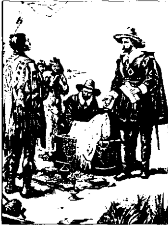
Колонизация как фактор модернизации. Губернатор голландской колонии Петер Минневит покупает у индейцев за 60 гульденов о. Манхэттен — место расположения будущего Нью-Йорка (1626).

Модернизация и, как следствие, образование основ современного общества опираются на нижеуказанные объективные предпосылки.