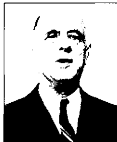
Шарль де ГОЛЛЬ (1890, Лиль — 1970, Коломбел-Дёз-Элиз) — выдающийся французский государственный, военный и политический деятель.

Пересмотр конституции (полный или в значительной ее части) — еще одна разновидность политических изменений, нередко оцениваемая как реформа. Но между этими понятиями есть отличия. Процедура единовременной ревизии основного закона государства используется в качестве политико-юридического инструмента, помогающего начать процесс мирной смены отжившего свое режима. Именно этим способом воспользовался такой мудрый политик, как де Голль, когда в 1958 г. представил на утверждение референдумом совершенно новый конституционный текст, и во Франции была институционализована V Республика — политический режим, существующий, с небольшими модификациями, до сих пор.