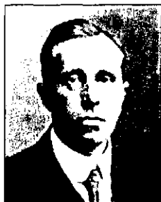
Йохан ХЕЙЗИНГА (1872, Гронинген – 1945, близ Ариема) – нидерландский философ, историк культуры, автор работы «Homo ludens» («Человек играющий», 1938), обосновавший феномен игры как универсального свойства всякой культуры.

Характеристиками традиционного общества с подачи Спенсера , Дюркгейма и Фердинанда Тённиса принято считать его основанность на механизмах простого воспроизводства, слабую заинтересованность в обмене результатами экономической активности с другими хозяйственными единицами по типу горизонтальных связей, преимущественную ориентированность на замкнутую жизнедеятельность и на самообеспечение. Особенности экономического базиса вполне соответствовали досовременное общественное строение (значительный количественный перевес сельского населения над горожанами и, соответственно, труда доиндустриального над индустриальным; слабовыраженная дифференциация и статичность социальной структуры) и политическая организация (явное преобладание автократических приемов властвования над согласованием пока еще смутно ощущаемых частных и групповых интересов; политика в целом, еще не выделенная в самостоятельную и специализированную сферу жизнедеятельности человека и т.п.).