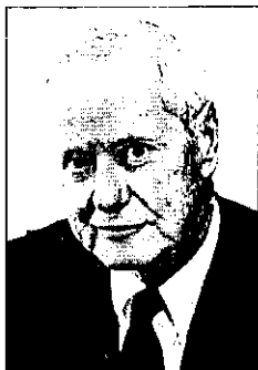
Роберт МЕРТОН (1910, Филадельфия – 2003, Нью-Йорк) – выдающийся американский социолог, внесший значительный вклад в развитие теории социальных наук.

пространство в полном его объеме, чтобы создать «модернизированного» человека.