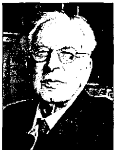
Арнольд Джозеф ТОЙНБИ (1889, Лондон – 1975, Йорк) британский историк, работавший в парадигме сравни- тельного исследования культур.

(1889–1966), Арнольда Тойнби и др. Их подходы отражали накопление западноевропейской цивилизацией элементов «старения» и «усталости». На смену данным концепциям в 1950–1960-е гг. вместе с разработками по теории модернизации вновь пришел своеобразный «исторический оптимизм» относительно быстрого осовременивания обществ третьего мира, а также получившие новую аргументацию общие представления о линейности и телеологичности (направленности к определенной предзаданной цели) исторического развития. Нетрудно заметить: идеалом общественного устройства для так называемых переходных обществ мыслилась западная экономика рыночного типа и отлаженная система политического представительства, т.е. западная модель.