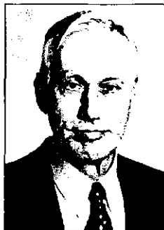
Аренд ЛЕЙПХАРТ — американский политолог, внесший значительный вклад в разработку теорий демократии и консенсуализма.

сомненно, укрепление государственного управления — центральная задача любой программы нациеобразования. Важно здесь то, что политическое развитие должно распространяться также на негосударственные (англ. nonauthoritative) институты общества.