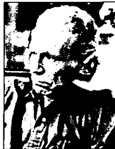
Альберт ХИРШМАН (род. 1915, Берлин) — американский политолог и экономист, специализирующийся на проблемах экономического развития.

В теории политического развития Альберта Хиршмана в качестве критического фактора рассматривается соотношение между (1) институциональными возможностями системы и (2) потребностями граждан, которые они выражают (3) своим политическим участием. Для стабильного развития по мере роста потребностей пропорционально должны увеличиваться возможности системы по их удовлетворению. В противном случае в обществе усиливаются негативные политические настроения. И наоборот, если возможности системы превышают темпы роста потребностей, то вероятно укрепление авторитарных (диктаторских) порядков, проведение политического курса с помощью силовых методов. Наконец, участие при отсутствии соответствующих институциональных возможностей служит причиной политической неустойчивости, в конечном счете — даже анархии. Общий теоретический вывод Хиршмана: для стабильного развития системе нужно сначала создать новые потребности и постепенно преодолевать отчуждение граждан от политики, а затем соответственно этим потребностям институционализировать опять-таки новые формы участия, для того чтобы его подъем не привел к подрыву политического порядка.