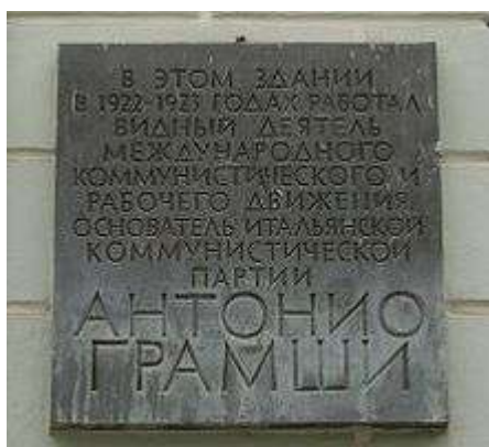
Мемориальная доска, Москва, ул. Моховая, 16

Октябрьская социалистическая революция 1917 года послужила активизирующим фактором его деятельности. В условиях послевоенного революционного подъёма в Италии Грамши выступил инициатором движения за создание фабрично-заводских советов, которое стало своеобразной формой борьбы итальянского пролетариата за власть в 1919—1920 годах . В мае 1919 года вместе с П. Тольятти , У. Террачини и другими молодыми социалистами создал еженедельник « L'Ordine Nuovo » («Новый порядок»). В январе 1921 года стал членом новообразованной Итальянской коммунистической партии .