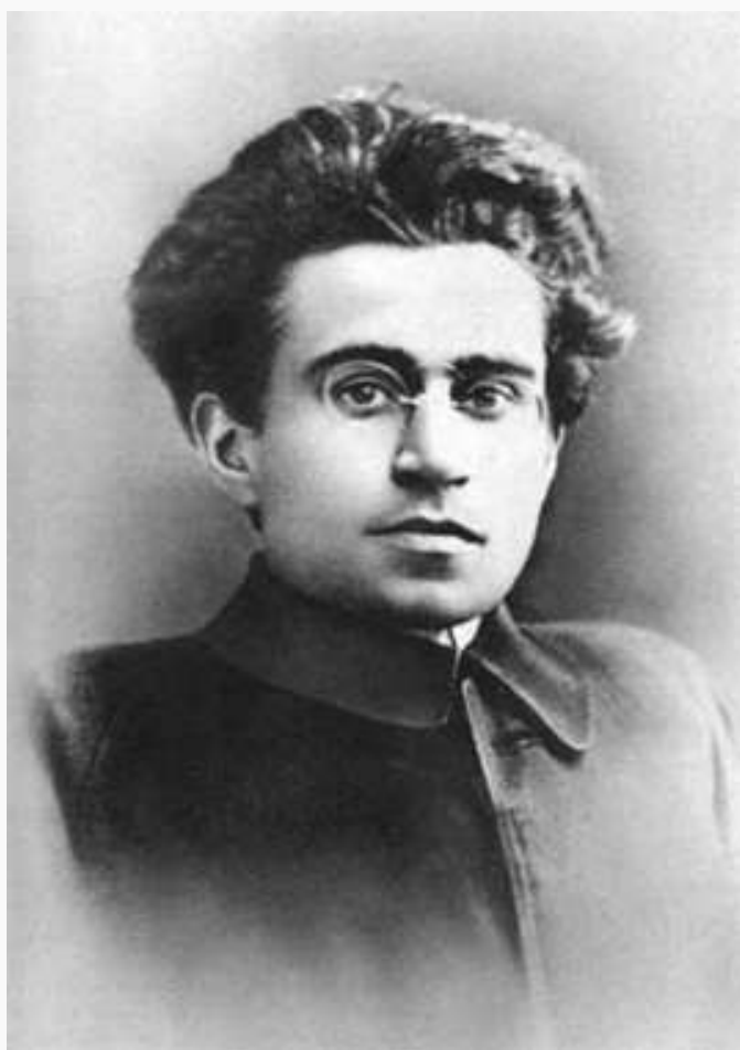
Фото 1920-х годов